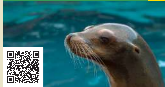
León Marino 1

www.parquedecabarceno.com www.turismodecantabria.com